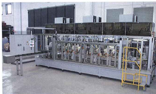
Dato che la macchina era destinata al Brasile, C.M. preferiva avvalersi di fornitori che avessero sedi in quel Paese

L'azienda, con sede a Milano, completa la qualità dei prodotti offerti con il proprio servizio di pre-vendita (aiuto nella scelta