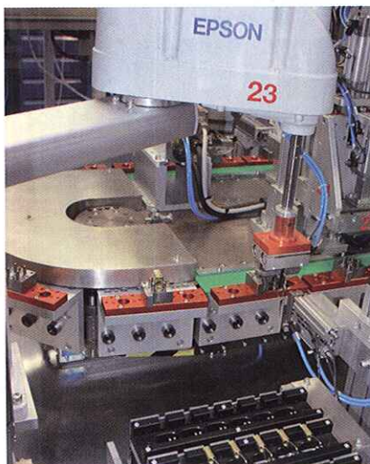
I robot Scara forniti da Sinta fanno parte della serie G modello G3-351S e sono comandati da unità di controllo dedicate modello RC180

I manipolatori sono gestiti da unità di controllo ultracompatte (302x170,5x275 mm), capaci di gestire simultaneamente i quattro assi con movimento punto-punto o interpolato. Le caratteristiche di memoria sono 128 MB di flash ROM, 64 MB di Dram, 128 kB di Sram; inoltre, il controller è dotato di 24 ingressi e 16 uscite digitali a isolamento ottico, con possibilità di espansione. Altre peculiarità tecniche di rilievo sono il linguaggio Spel+ per una programmazione semplice e completa, l'ambiente di sviluppo integrato nell'unità di controllo e il facile interfacciamento del programma robot con eventuali altre applicazioni mediante DLL.