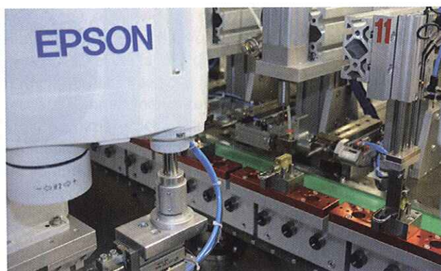
Per garantire una cadenza di montaggio di un lucchetto ogni 5 s C.M. ha scelto di adottare i robot Epson

della macchina attraverso uno studio di fattibilità, calcolo del tempo ciclo e realizzazione di prove dimostrative in laboratorio) e post-vendita (corsi di programmazione e manutenzione, soluzione di eventuali problemi d'interfacciamento, supporto nella fase di messa in servizio del robot, fino ad arrivare all'intera programmazione della macchina, oltre al servizio di manutenzione programmata e agli interventi d'urgenza per riparazione e riavvio del robot).