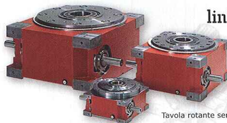
Tavola rotante serie TR disponibile in 13 grandezze