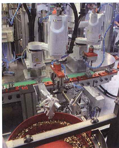
La macchina si occupa di assemblare tre modelli di lucchetti partendo dai singoli componenti che vengono caricati (tranne due) in automatico

(tranne due) in automatico. La linea è costituita da 56 posaggi e dopo ogni singola operazione è previsto il controllo della corretta esecuzione. L'esigenza di C.M. era di ottenere una cadenza di montaggio di un lucchetto ogni 5 s. Per poter garantire simili prestazioni l'azienda necessitava di ben quindici robot Scara in grado di assicurare velocità, prestazioni dinamiche,