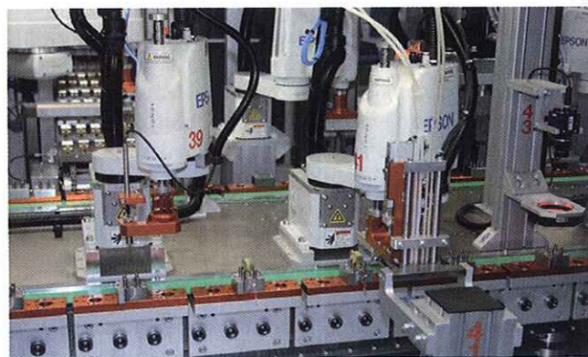
Grazie al corpo compatto il manipolatore ha un ingombro contenuto